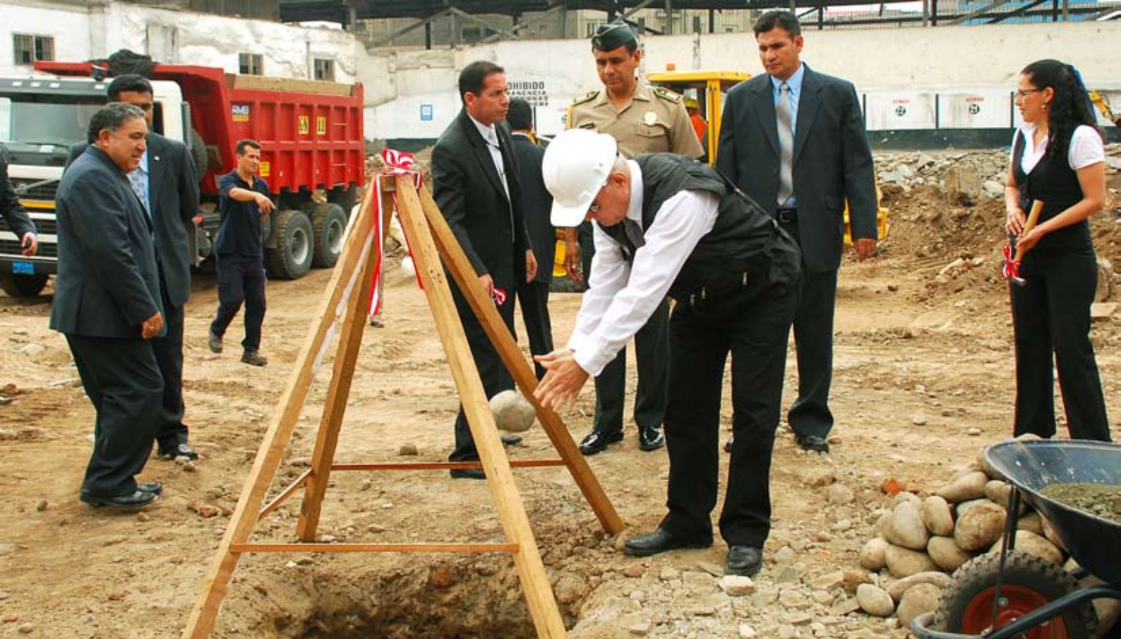
El Presidente del Poder Judicial coloca primera piedra de la nueva sede de los Juzgados y Salas Penales Especiales

Se inició construcción de sede de Salas y Juzgados Penales