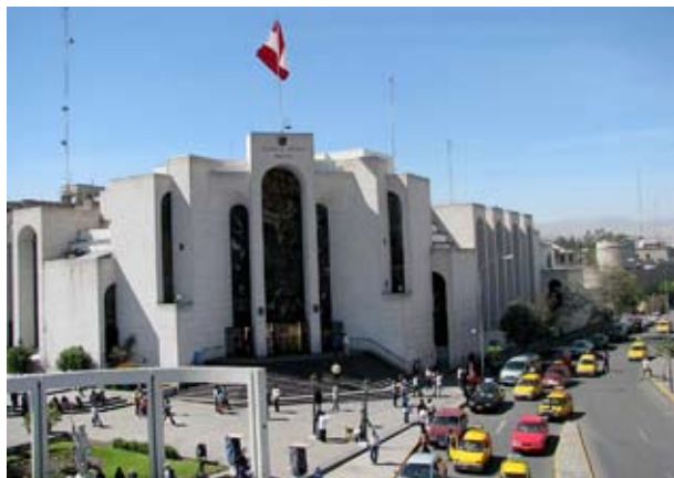
Frontis de la Corte Superior de Justicia de Arequipa