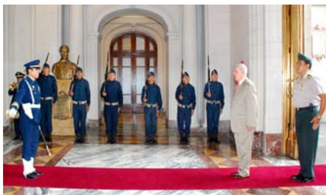
Honores al Presidente

La ceremonia de honores consiste hoy en el izamiento de las banderas del Perú y del Poder Judicial en la explanada frontal del Palacio, al compás de la Marcha de Banderas interpretada por un corneta, y en los honores que la guardia militar de turno rinde al Presidente antes de comenzar sus actividades.