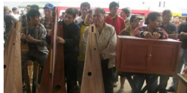
En el taller de carpintería, los internos fabrican arpas a un valor de 300 soles