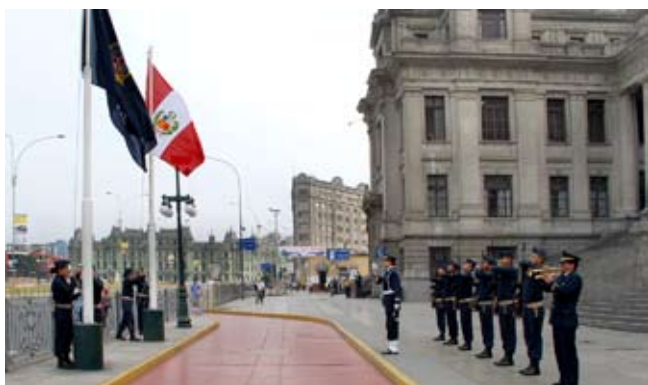
Izamiento de las banderas del Perú y del Poder Judicial

Una guardia de honor de las Fuerzas Armadas de turno, rinde honores diarios al Poder Judicial del Perú como Poder del Estado, en la persona del doctor Javier Villa Stein, a su llegada a Palacio de Justicia.