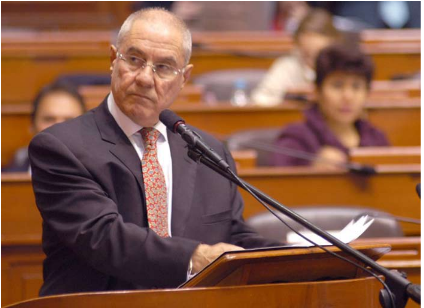
La descarga procesal es uno de los principales compromisos de la gestión del doctor Villa Stein