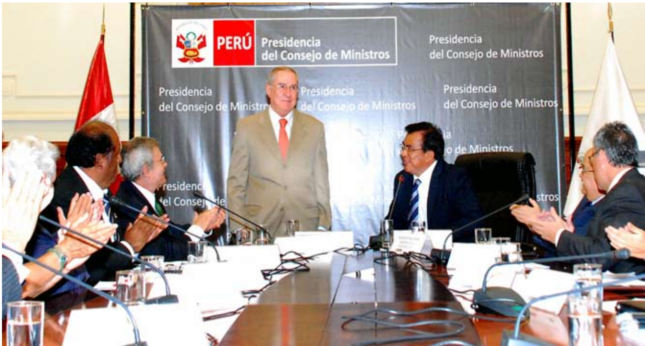
Miembros de la comisión aplauden al doctor Javier Villa Stein luego de su designación

E l Presidente del Poder Judicial del Perú y flamante Presidente de la Comisión de Alto Nivel Anticorrupción declaró que “es necesario que el Estado en su conjunto sea honorable, cumpla sus compromisos, los contratos y los pactos con los trabajadores. Estado moderno no puede convivir con la corrupción».