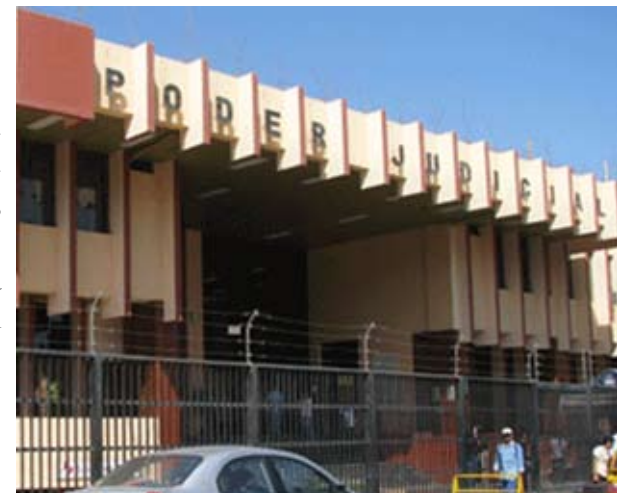
Frontis de la Corte Superior de Justicia de Ica.

El condenado se comprometió a pagar la reparación civil que se le impuso ascendente a 300 nuevos soles. La sentencia indica asimismo que Lloclla Jáuregui deberá cumplir normas de conducta previstas en el Artículo 64 del Código Penal, bajo apercibimiento de aplicarse lo dispuesto en el Artículo 65 del precitado Código.