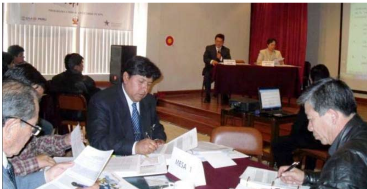
A la fecha se han realizado 32 talleres denominados “Diálogos de la OCMA, promoviendo la transparencia del Poder Judicial”

E l Programa Umbral es el resultado de un Convenio de Donación entre el Gobierno de los Estados Unidos y el Gobierno del Perú, suscrito el 9 de junio de 2008, como paso previo para que el Perú sea considerado elegible a fondos de donación mayores, provenientes de la Corporación del Desafío del Milenio (MCC). El Programa Umbral tiene una duración de dos años y un presupuesto de US$ 35.6 millones.