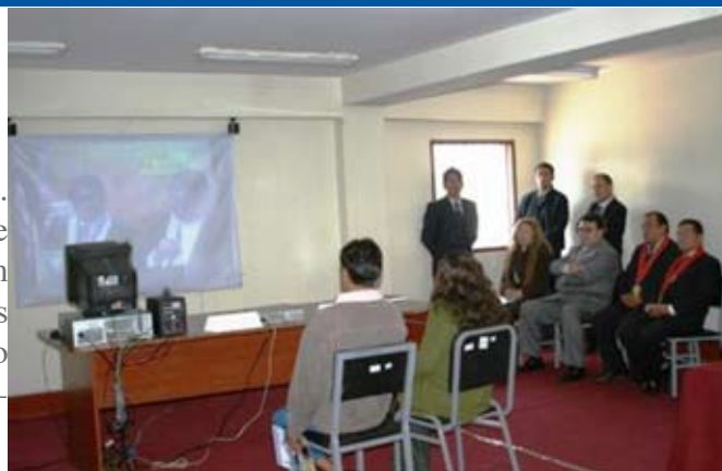
Procesado, acompañado de su abogada, responde las interrogantes de la Juez y Fiscal desde Tayacaja vía el sistema interconectado.

Tras la audiencia que duró aproximadamente 50 minutos, la secretaria de Pampas remitió el acta vía correo electrónico a la base instalada en el Penal de Huancayo, dicho documento luego de ser impreso fue entregado al procesado y abogada, quienes tras verificar el contenido procedieron a estampar su firma correspondiente.