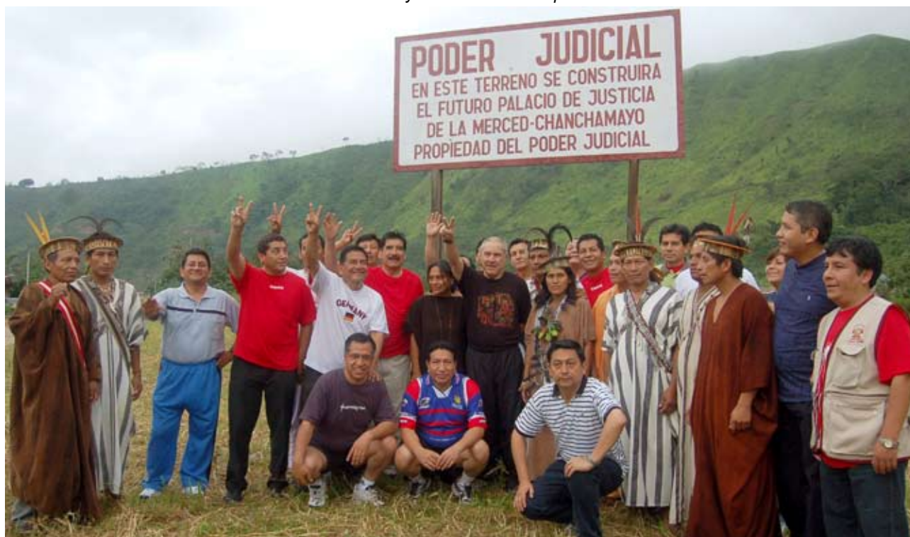
Autoridades de Chanchamayo donaron terreno para el Palacio Judicial

Asimismo, invitaron a la máxima autoridad judicial para que participe en el próximo Encuentro de Jefes de Comunidades Nativas que se realizará en el mes de febrero en esta zona central del país.