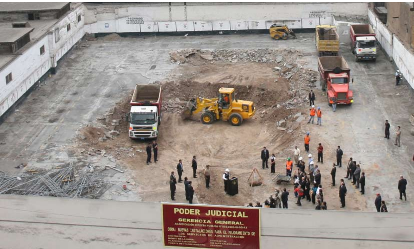
Vista panorámica del terreno donde ya se construye nuevo local

Se prevé construir la nueva sede de la Corte Superior del Callao con una inversión 25 millones de soles, mejorar los servicios de administración de justicia de la sede de la Corte de Moquegua por un monto cercano a los 9 millones de soles y la capacidad del servicio de archivo de la Corte de Piura con alrededor de 7 millones de soles.