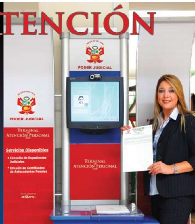
Muestra del panel publicitario del Terminal de Atención Personal