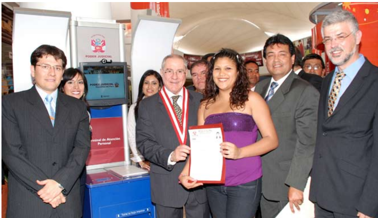
Módulo de TAP atenderá de lunes a domingo

Como un acto de gran trascendencia, consideró el Presidente del Poder Judicial, doctor Javier Villa Stein, el 25 de enero último, la entrega a los usuarios del servicio de justicia el Terminal de Atención Personal (TAP), ubicado en el centro comercial Mega Plaza del distrito de Independencia, en el cono norte de Lima.