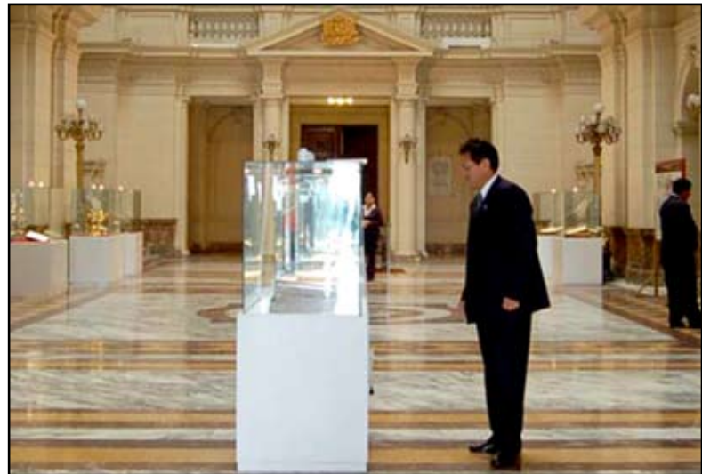
Artículos de colección del Museo del Poder Judicial

E n cuatro ambientes del Palacio Nacional de Justicia se exhiben diversos e históricos objetos del Museo de la Justicia, que evocan procesos judiciales que alcanzaron resonancia nacional en el pasado y otros que contribuirán a comprender el desarrollo de la impartición de la justicia en nuestra patria.